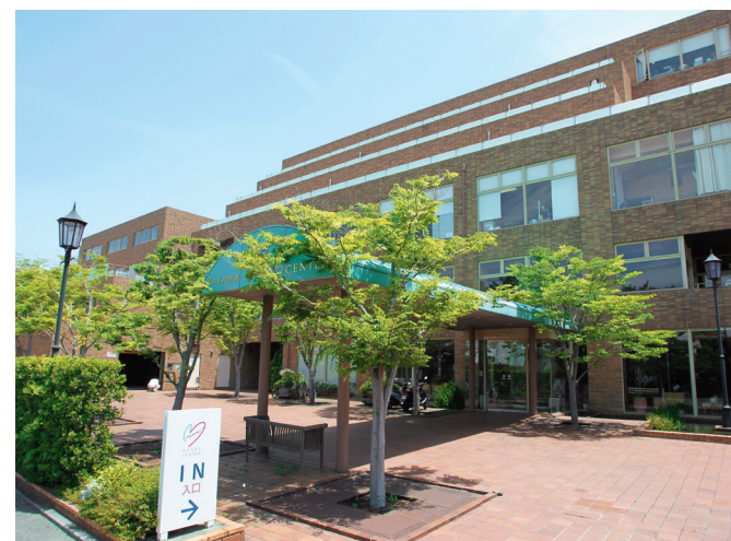
HAYAMA HEART CENTER Recruit Guide

HAYAMA HEART CENTER 医療法人徳洲会 葉山ハートセンター tel:046-875-1717 [9:00~17:00] 〒240-0116 神奈川県三浦郡葉山町下山口 1898-1