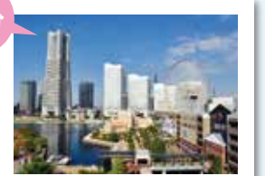
横浜みなとみらい